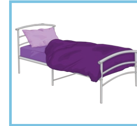
un lit a bed