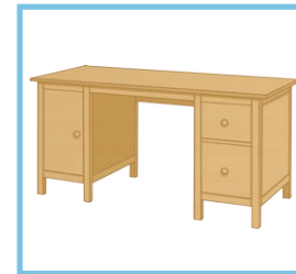
un bureau a desk