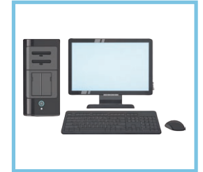
un ordinateur a computer