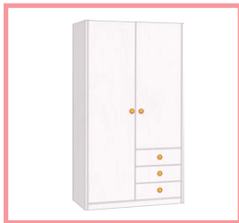
une armoire a wardrobe