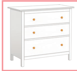
une commode a chest of drawers