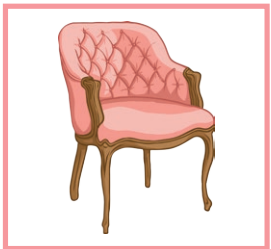
une chaise a chair