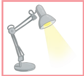
une lampe a lamp