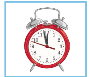
un réveil an alarm clock