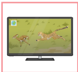
une télévision a television