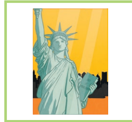
des posters posters