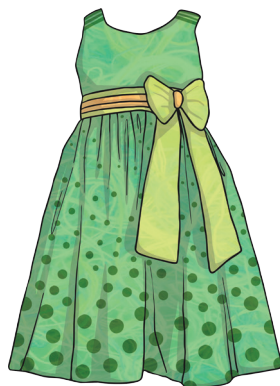
une robe verte