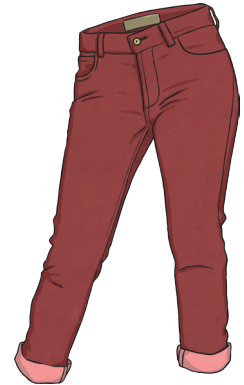
un pantalon rouge