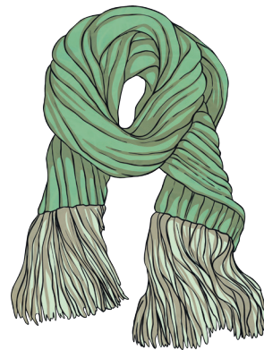
une écharpe verte