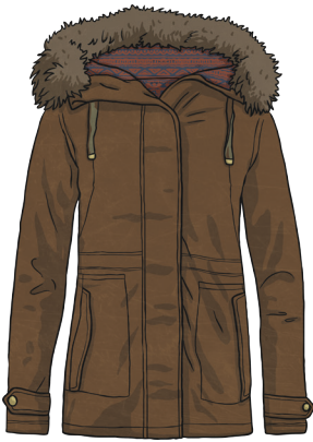
un manteau marron